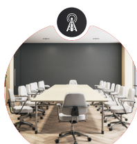
Sensor de qualidade do ar/contagem de pessoas