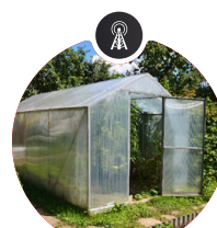
Sensor de umidade e pH do solo