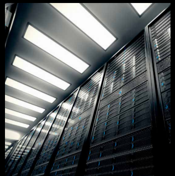
Rechenzentren und Infrastruktur