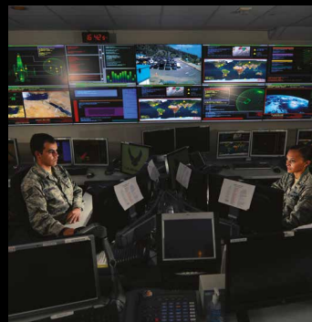
Steuerung und Kontrolle