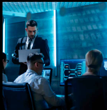
Glasfaser zu Desktop