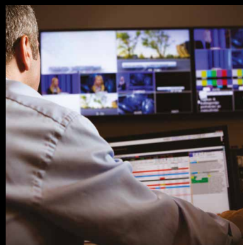
Experiencia de usuario simplificada