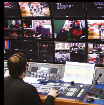
Controladores de videowall