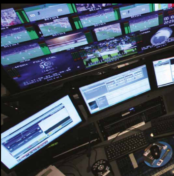
Matriz de conmutación y extensión KVM