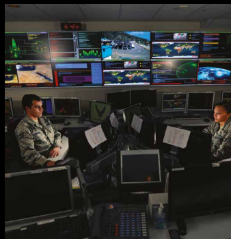
Commander et contrôler