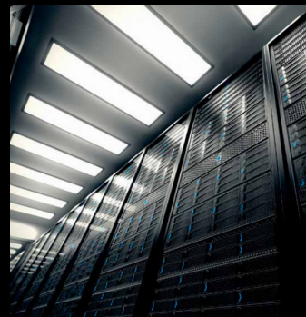
Centre de données et Infrastructure